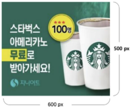
보물상자 [스퀘어 배너]

사용자의 편의성을 저해하지 않는 광고 노출, 앱 이용에 따른 혜택과 동기부여를 위한 광고를 운영하고 있습니다.